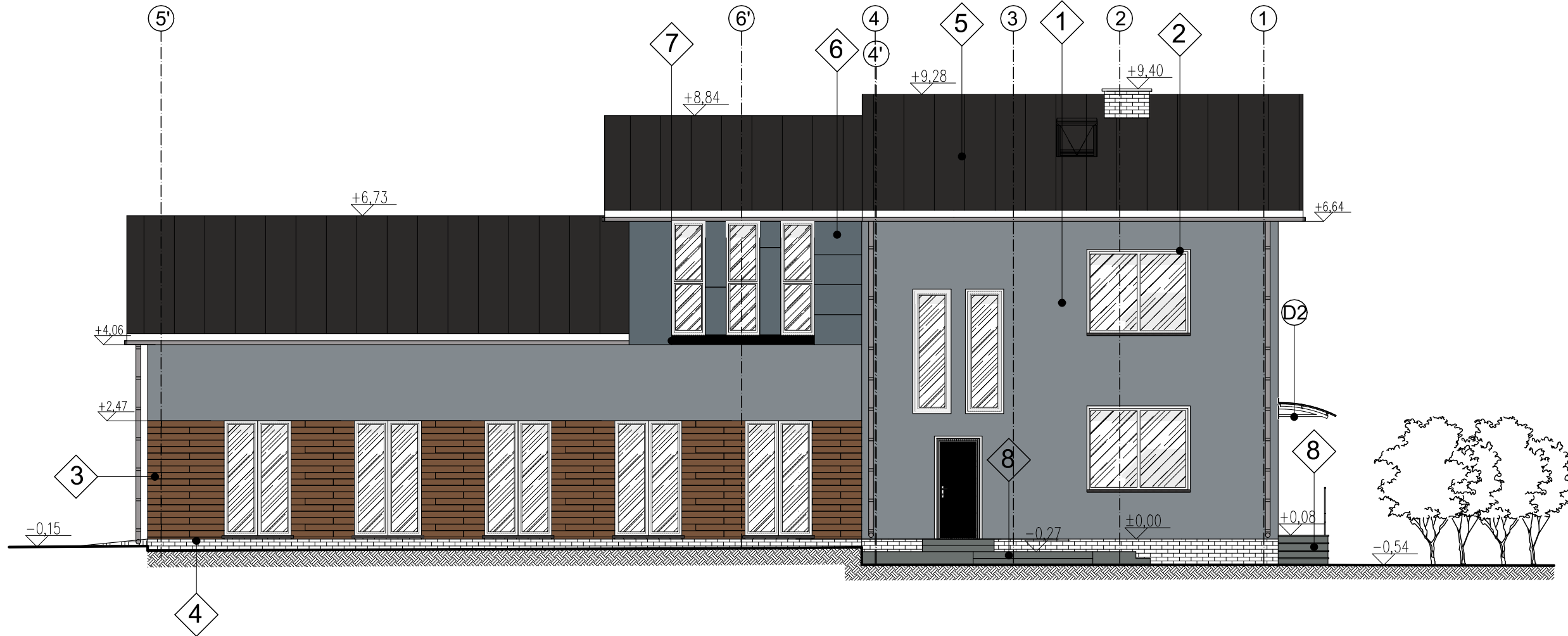
ELEWACJA POŁUDNIOWA SKALA 1:100